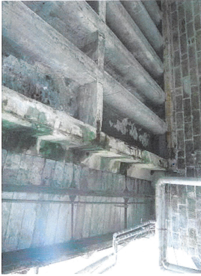
5 zatékání na krajní trám na výtoku.JPG