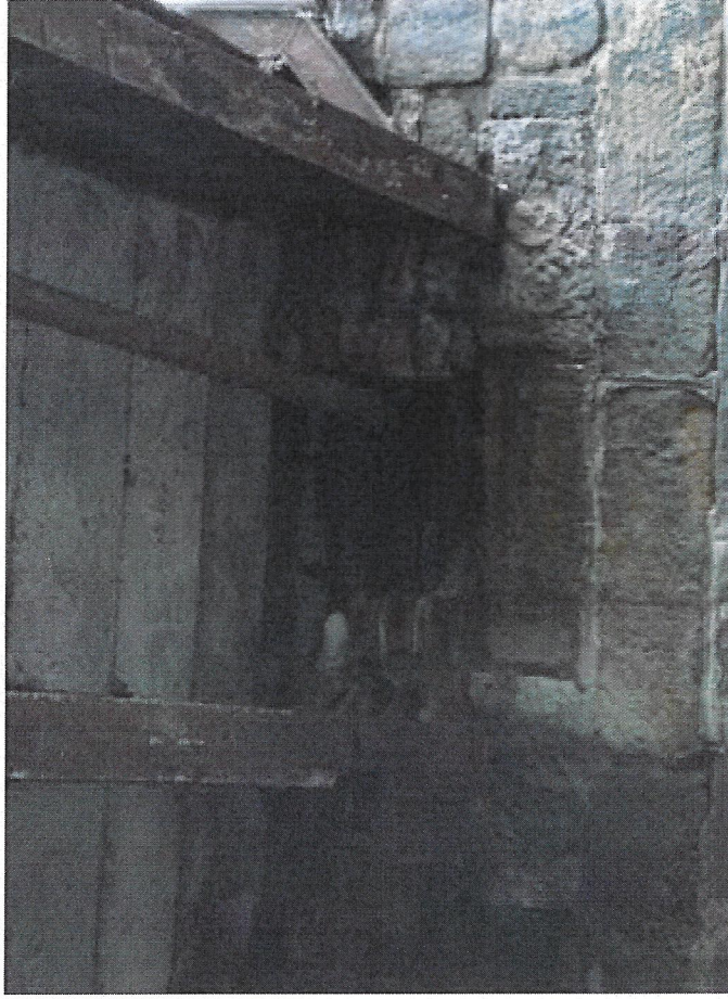
09 detail 100% koroze spodní příruba I profilu v rozšíření vpravo na vřoku.JPG