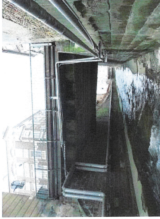
3 pohled výtok.JPG