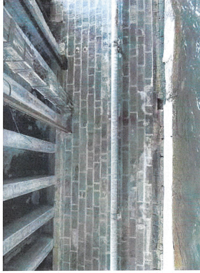
8 pravá opěra.JPG