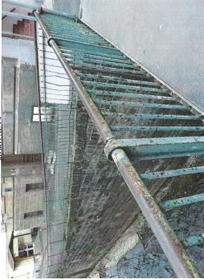
11 zábradlí na vřoku.JPG