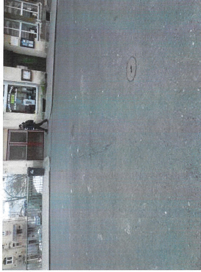
10 příčné trhliny vpravo na konci mostu.JPG