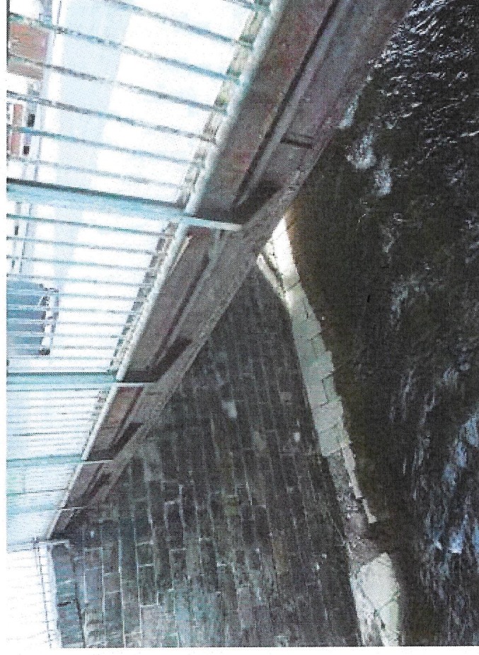
7 koroze rozšíření na vtoku.JPG