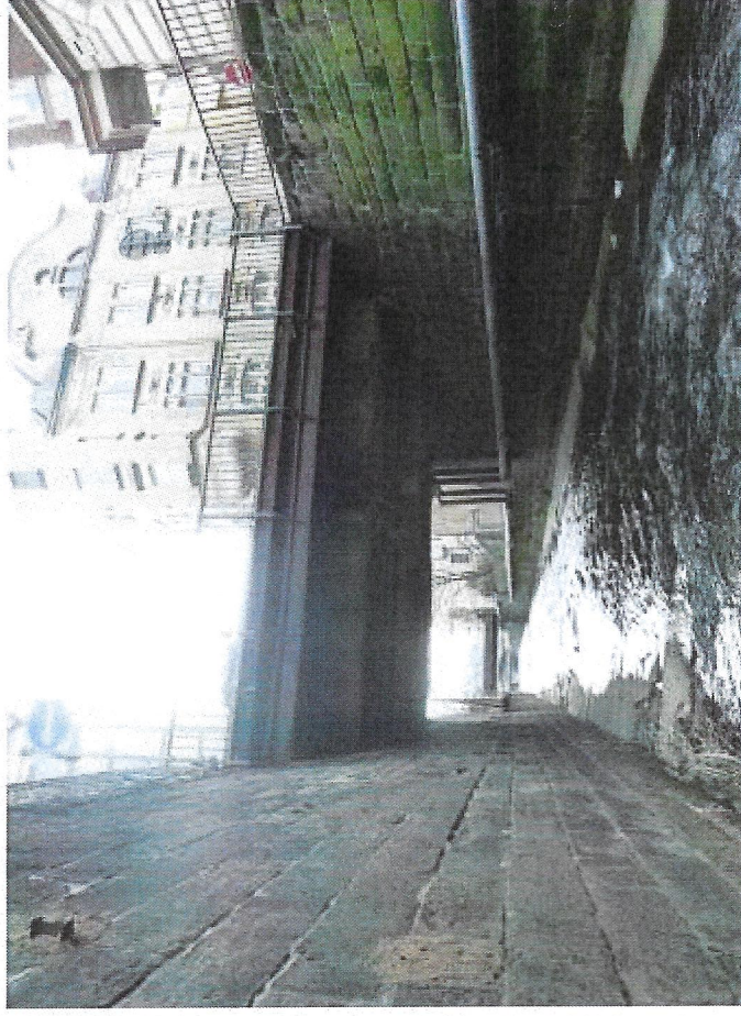
2 pohled vtok.JPG