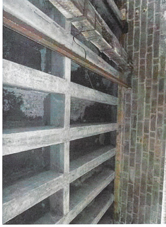
4 pohled NK.JPG