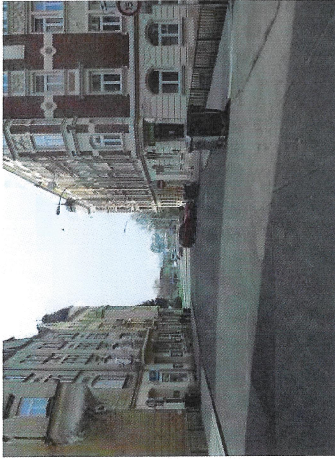
1 celkový pohled zleva.JPG