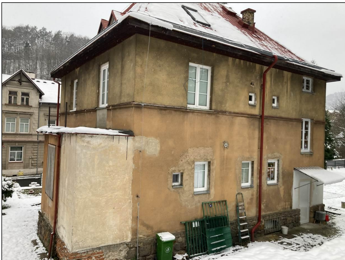
východní průčelí a jižní štít